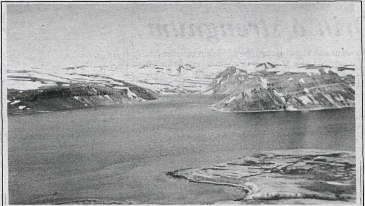
TF-RÁN fórst undir Kvíarfjalli, sem er lengst til vinstri á þessari mynd. Fyrir miðju er Lónsfjörður og til hægri sést í mynni Hrafnfjarðar.