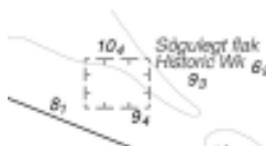
Chart No. 367